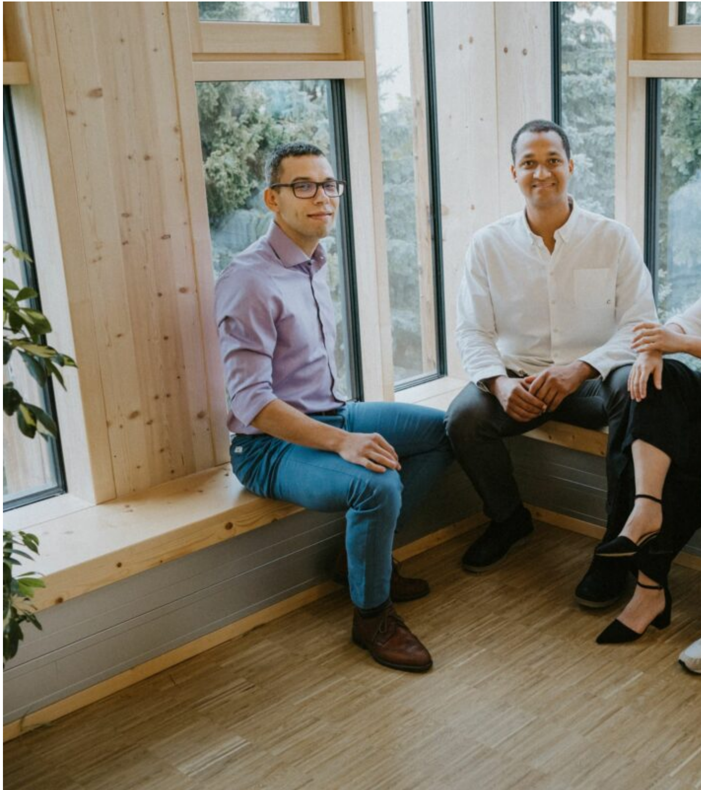
Team Beetle ForTech